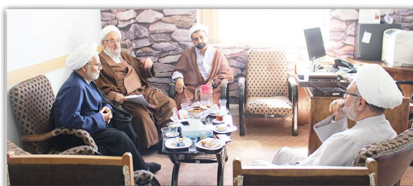
دیدار رئیس اداره همکاری‌ها و تعاملات با سازمان عقیدتی سیاسی ارتش جمهوری اسلامی