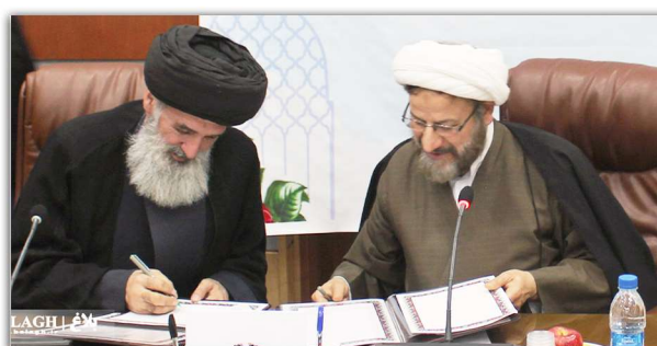
امضا تفاهم نامه دفتر تبلیغات اسلامی حوزه علمیه قم با سازمان عقیدتی سیاسی وزارت دفاع