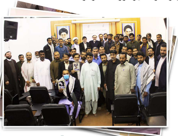
سلسله اردوهای آموزشی ویژه فعالان فرهنگی

مَنْ تَعَلَّمَ لِلَّهِ وَعَمِلَ لِلَّهِ وَعَلَّمَ لِلَّهِ، وَعَمِلَ لِلَّهِ، وَعَلَّمَ لِلَّهِ