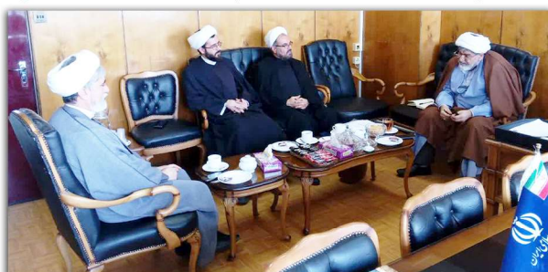
جلسه بررسی زمینه های همکاری مشترک بین دفتر تبلیغات اسلامی و ستاد اقامه نماز وزارت نفت