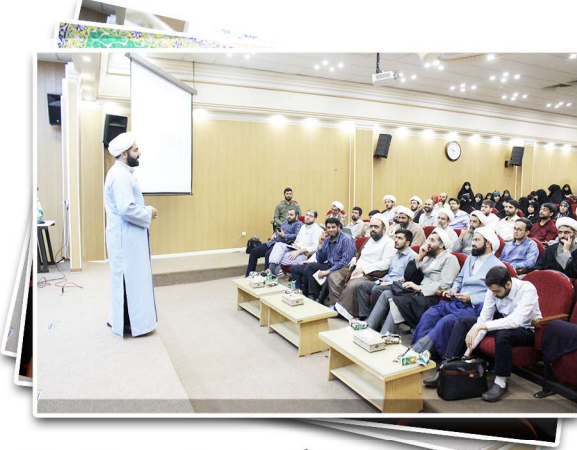
سلسله کارگاه حضوری بازی و مسابقات معارفی