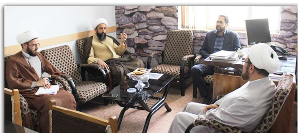
جلسه بررسی زمینه های همکاری مشترک بین دفتر تبلیغات اسلامی و وزارت نیروی جمهوری اسلامی